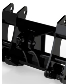
SYSTÈME D'ATTACHE RAPIDE LUNDBERG (VOLVO)