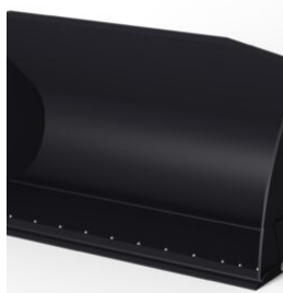
GODET CHARGEUR A HAUT DEVERSEMENT