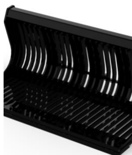
GODET CHARGEUR SQUELETTE